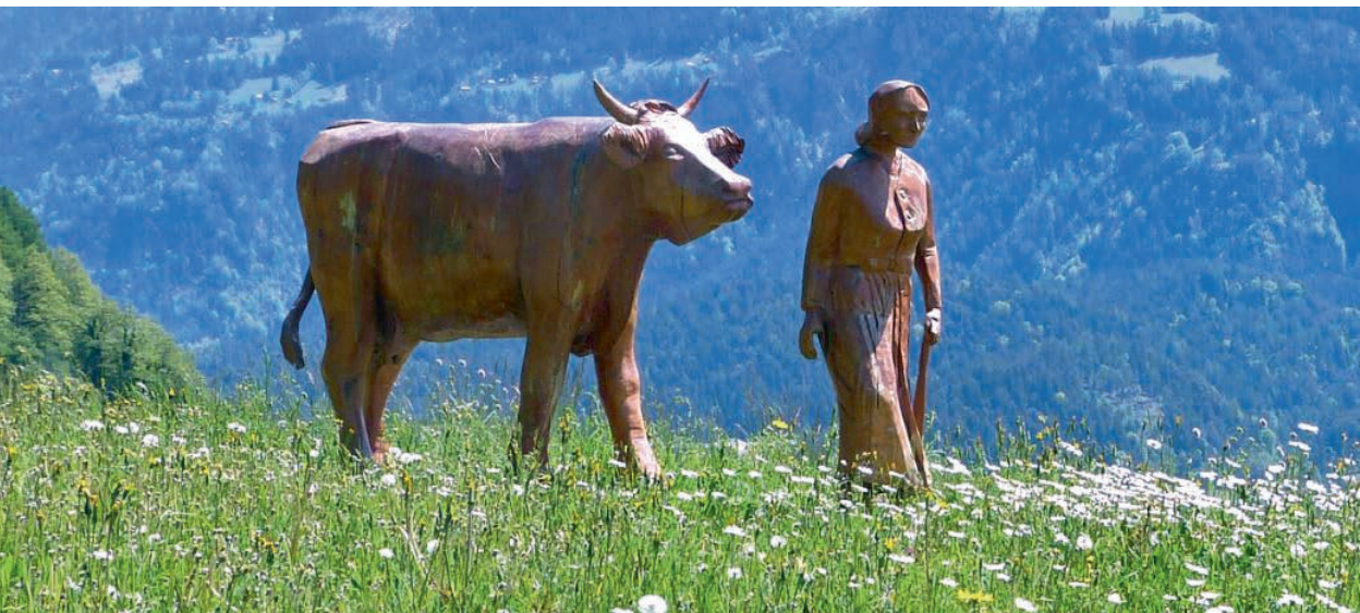
«Bäuerin mit Kuh» von Karin Brenn, Trin-Digg ( www.karinbrenn.ch )