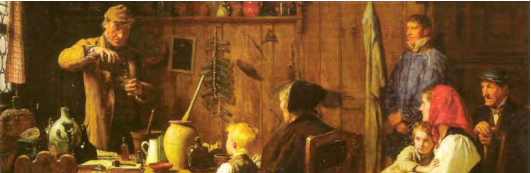
Bild: Albert Anker, Der Quacksalber